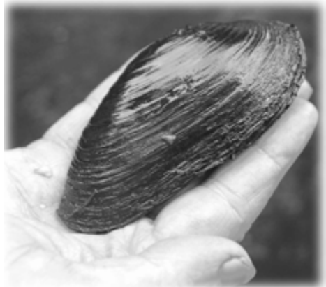
Elvemusling (Margaritifera margaritifera)